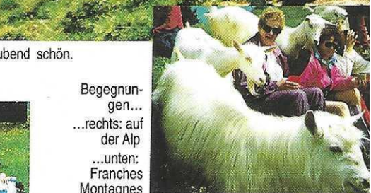
Begegnungen... ...rechts: auf der Alp ...unten: Franches Montagnes