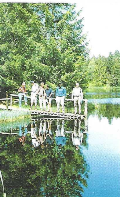
Spiegelin auf dem Grund, wer ist der Schönste in dieser Männer-rund?