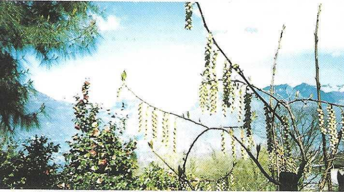
Der frühe Frühling im Tessin verkürzt uns den langen Winter des Nordens

PPS Sich schützen vor der Enttäuschung, kein Plätzchen mehr zu bekommen, kann man durch frühzeitige Anmeldung. (Das ist nicht Werbegag, sondern gutgemeinter Hinweis.)