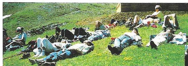
Wann immer möglich: ausgedehnte Mittagsrast und -Ruh