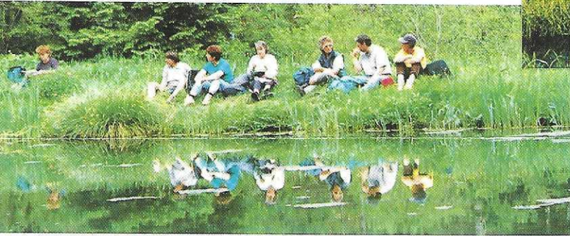
Wo's friedlich und gemütlich ist, da lassen wir uns nieder (Tee-Pause)