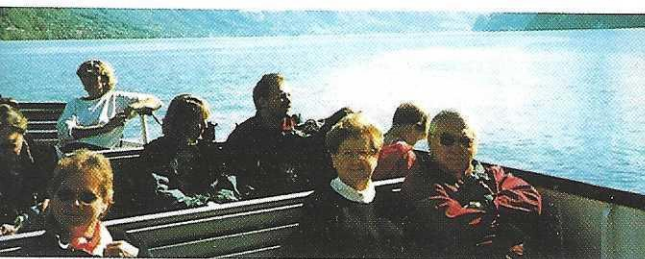
Wir nutzen gerne Ö.V. zu Wasser, zu Land und in der Luft!