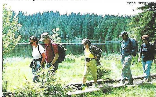
Weicher Weg mitten durch das Moor